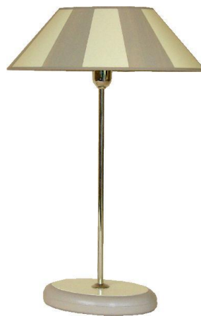
Cremona ST-003 L Streifen sand/creme .....Füße Sonderanfertigung auf Anfrage .....