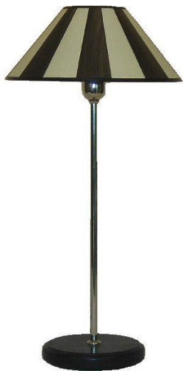
Pavia PR-090 L Streifen schwarz Singolo 31-1-R-L 171 SW Ni