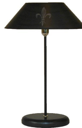
Cremona UL-210 G schwarz, Lilie silber .....Füße Sonderanfertigung auf Anfrage .....