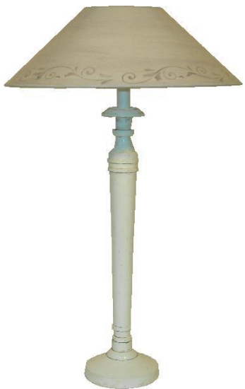
Brescia PR-110 L Schleifenranke Schwedisch grau auf hellgrau Prato L CRP 60 Watt