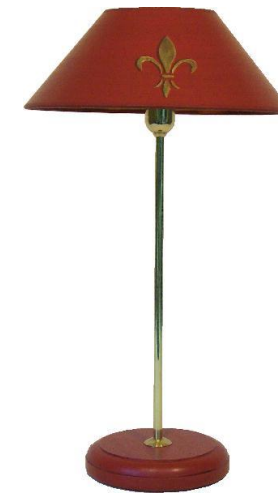
Lodi 6-7 G englisch rot, Lilie gold ..... Füße Sonderanfertigung auf Anfrage .....