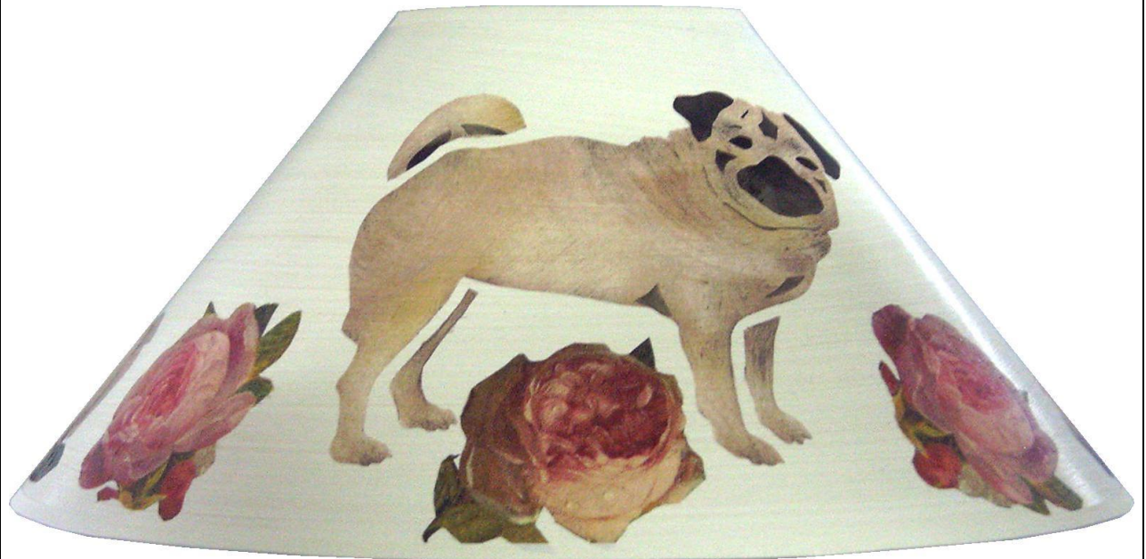
Schirm Lodi MÖ-004 L Mops mit Rosen

Eine exklusive Kollektion handgefertigter Lampenschirme mit Messing-Lampenfüßen in creme oder schwarz gesteltet.