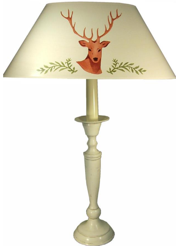
Como JG-002 G oval, Hirsch auf creme Arezzo CR P

Wir kombinieren für Sie individuell Lampenfüße und -schirme aus dem vorliegenden Katalog, oder die Schirme einzeln, mit Kreuz-, Nippelloch- Clip- oder Tulpenmontage passend zu jedem entsprechenden Lampenfuß.